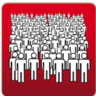
Lots of People